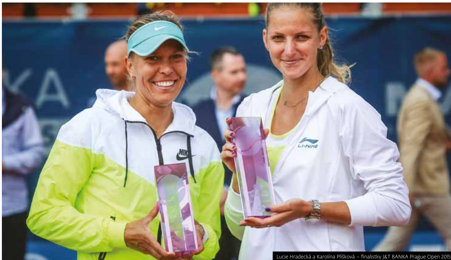
Lucie Hradecká a Karolína Plíšková – finalistky J&T BANKA Prague Open 2015

Pokud jste nejlepší české tenistky v akci loni zmeškali, na konci dubna budete mít šanci to napravit. V pražské Stromovce se totiž uskuteční už druhý ročník turnaje J&T Banka Prague Open.